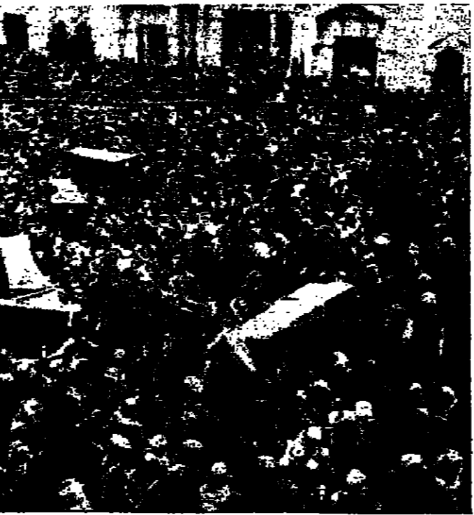
مشهد لموكب تشييع الشهداء الابرار المسبحة لدى خروجه من المسجد الحسيني في عمان بعد صلاة الجمعة